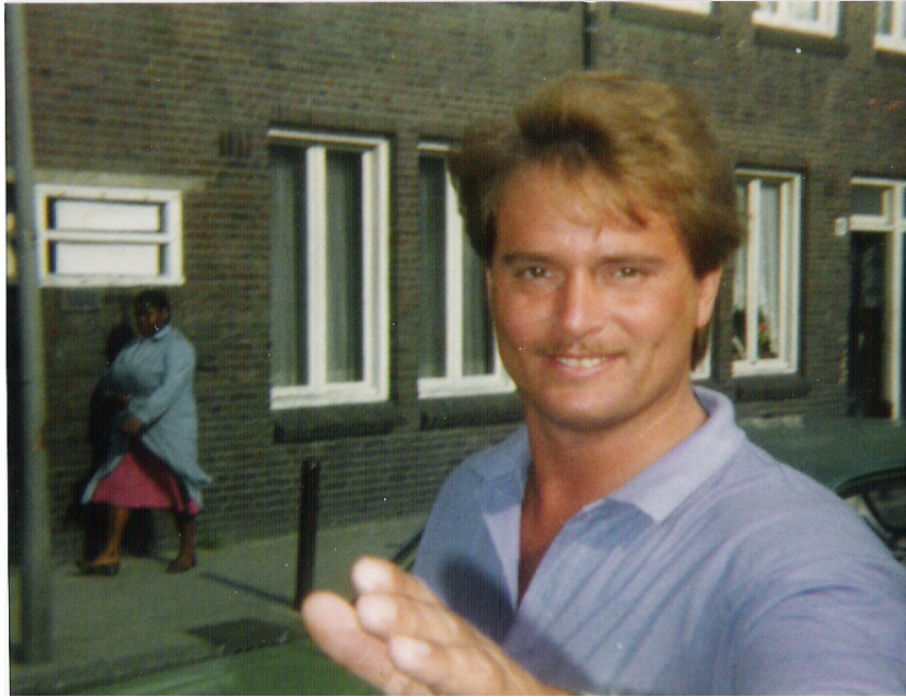
Een foto toen ik nog achter de bar werkte